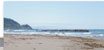
砂浜にゴミ等が溜まっている