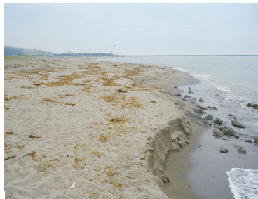
砂浜が削られている