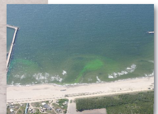
近くに人工構造物がある